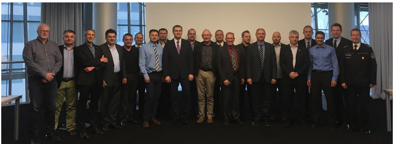
Gruppenfoto der 4. Tagung der CTIF Arbeitsgruppe „Freiwillige Feuerwehren“ in Berlin, Deutschland